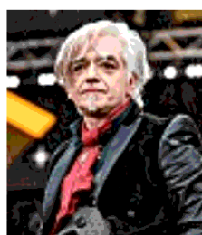
Il cantautore Morgan

Il soffitto di cristallo tiene ancora. Nelle classifiche italiane del primo semestre del 2024, secondo i dati ufficiali di Fimi/Gfk, ci sono ancora poche donne. In quella album 15 su 100 posti (nello stesso periodo del 2023 erano 12); in quella singoli la presenza femminile come main artist passa da 25 a 32 posizioni.