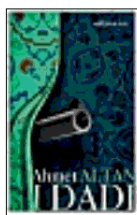
AHMET ALTAN IDADI (traduzione di Nicola Verderame, e/o) Diventare uomini alla fine dell'impero romano. Una voce dal carcere