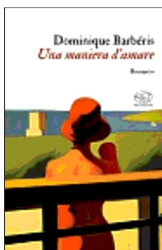
DOMINIQUE BARB RIS UNA MANIERA D'AMARE (traduzione di Paolo Bellomo e Luca Bondioli Clichy, pp. 224, euro 19,50)

Una storia incompiuta nel Camerun degli Anni 50