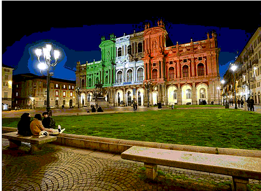
Il Museo del Risorgimento illuminato con il tricolore per celebrare i 160 anni dell'Unità d'Italia

A uguri. Si perché oggi è la festa dell'unità d'Italia, 160 anni portati con qualche acciaccio. Ricordate le bandiere appese ai balconi di Torino per il 150esimo? Fu una grande festa, un grande orgoglio nazionale e cittadino. Anche oggi ci sono alcune bandiere sui balconi della città, ma lo spirito è del tutto diverso. Sembra passato un secolo e invece sono solo dieci anni. Contrassegnati dalla pandemia ovviamente, ma anche da uno spirito che tende a vedere il bicchiere sempre mezzo vuoto. Secondo noi, questo è sbagliato. Saremo in crisi, ma siamo pur sempre una città di eccellenze. Che ogni tanto vanno lucidate altrimenti saremo costretti a vivere nella polvere. © RIPRODUZIONE RISERVATA